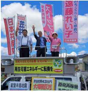
8/15 終戦記念日に街宣

20数年も前から自民党が政治資金パーティーで「裏金」を生み出していたことをスクープ。国民の世論と運動に追い詰められ、政治資金規正法「改正」をしたものの、政治資金パーティーや政策活動